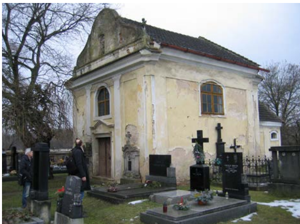
Hřbitovní kaple povýšení Sv. Kříže jak jsme ji našli v r. 2007. Něco nám nesedělo, chyběla nám jistá vertikálnita.