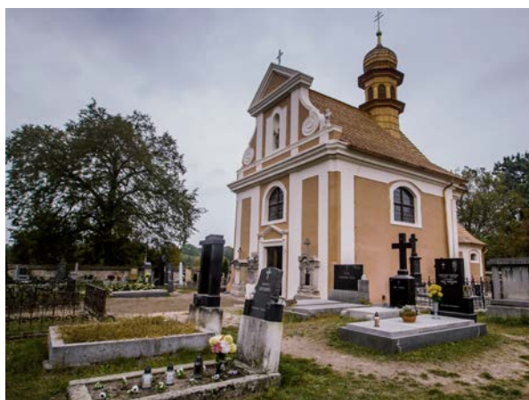
Tatáž hřbitovní kaple Sv. Kříže jak jsme ji opouštěli v r. 2015. Vertikalita už nám nechyběla. Jako jediná stavba celého areálu nemá pozdně klasicistní zelenou, ale naši ranně barokní okrovou.