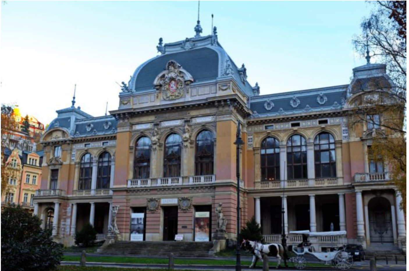
Císařské lázně Karlovy Vary - listopad 2018.

Karlovarský kraj zrušil původní výběrové řízení na rekonstrukci karlovarských Císařských lázní. Po zkoumání v posledních měsících se ukázalo, že v tendru byly chyby. Nové výběrové řízení by mohl kraj vyhlásit krátce po Novém roce, až bude mít na stavbu stavební povolení, řekla hejtmanka Karlovarského kraje Jana Mračková Vildumetzová (ANO).