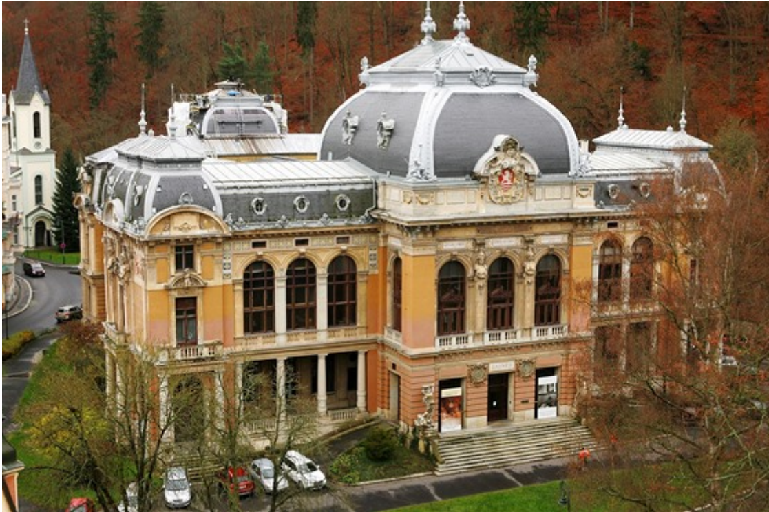
Karlovarské Císařské lázně.

Kraj už zná základní provozní model Císařských lázní v Karlových Varech. Poté, co hejtmanství tuto národní kulturní památku opraví, měla by její každoroční celková bilance vykazovat bez krajského příspěvku minus dva miliony korun.