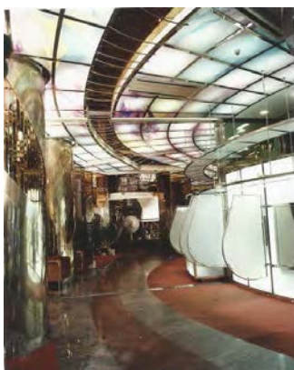
Úprava vstup. haly s bankomaty 1998 a vpravo vstup od r. 1994.