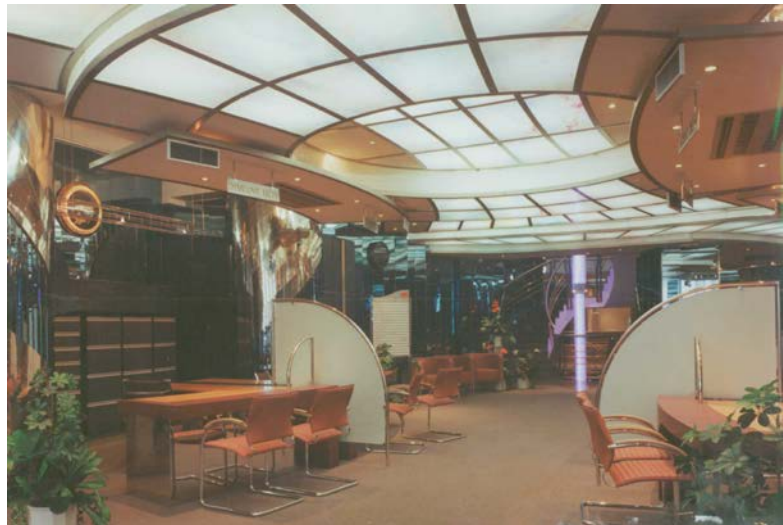
Horní bankovní haly ve 2. až 3. NP. Mobiláře byl navržen v designu pevného interiéru a vyroben na zakázku firmou Faram z Udine.