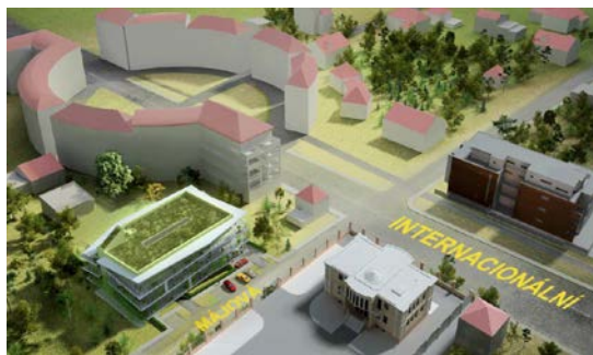
Po dohodě se stavebníkem, celková redukce stavby na izol. viladům tak, aby žádost o úpravu ÚP měla šanci. 2015