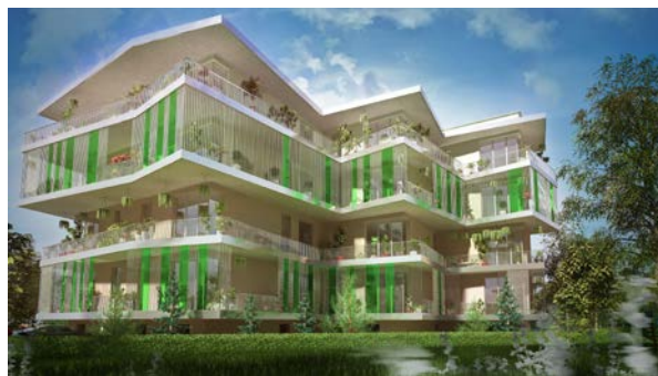
Nová už 4 podlažní stavba na novém tvaru pozemku v principu trojúhelníkového tvaru s výraznými zelenými terasami 2012.

Začalo období obstarávání podpory našeho záměru. Konzultovali jsme s autorem ÚS Suchdol „Na Mírách“ s arch. Turkem (před tím jsme od p. starosty obdrželi ÚS od tehdejšího ÚRMu z r. 2000), žádali jsme o ÚPI stavební úřad Prahy 6, ta se nám ale nelíbila, tak jsme požádali IPR Prahy o metodickou pomoc. V r. 2014 byla dostavěna Palestinská ambasáda a monotónnost RD v našem okolí tak padla. Tak jsem začal stavbu všelijak upravovat a všelijak aktualizovat. Na základě druhého kola konzultací s ÚRM byla stavba zmenšena, půdorysně i výškově, ze 4 na 3 podlaží. Principem bylo, aby náš podnět na změnu / úpravu ÚP spočívající ve změně koeficientu KPP změnil ne z „B“ na „F“,