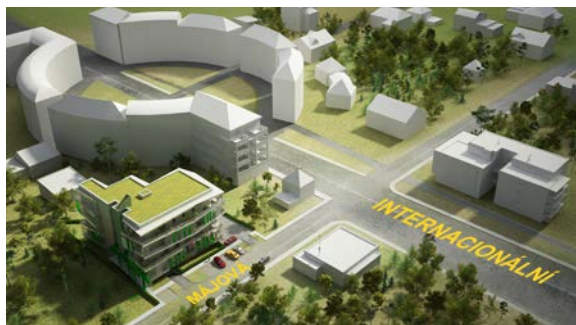
Původní odsakovaný tvar s ohledem na trojúhelníkový pozemek a požadovanou kapacitu stavebníkem 2012.

Začalo období obstarávání podpory našeho záměru. Konzultovali jsme s autorem ÚS Suchdol „Na Mírách“ s arch. Turkem (před tím jsme od p. starosty obdrželi ÚS od tehdejšího ÚRMu z r. 2000), žádali jsme o ÚPI stavební úřad Prahy 6, ta se nám ale nelíbila, tak jsme požádali IPR Prahy o metodickou pomoc. V r. 2014 byla dostavěna Palestinská ambasáda a monotónnost RD v našem okolí tak padla. Tak jsem začal stavbu všelijak upravovat a všelijak aktualizovat. Na základě druhého kola konzultací s ÚRM byla stavba zmenšena, půdorysně i výškově, ze 4 na 3 podlaží. Principem bylo, aby náš podnět na změnu / úpravu ÚP spočívající ve změně koeficientu KPP změnil ne z „B“ na „F“,