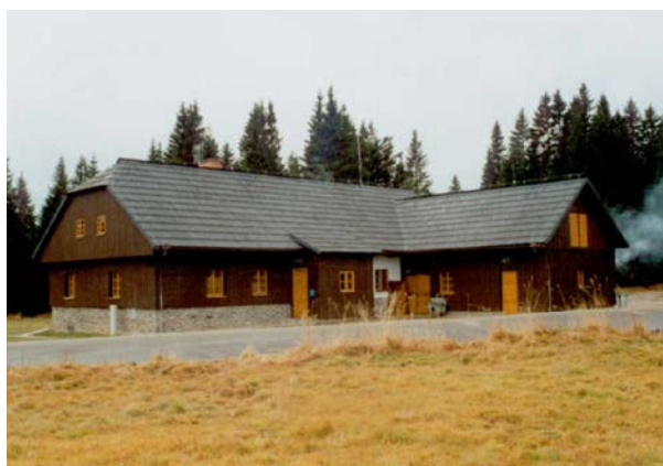
Hájovna č.p. 12 na Horské Kvildě. Tu jsme začali rekonstruovat, ona se rozpadla, tak jsme stavbu postavili úplně znovu, ale v původní šumavské architektuře a ukázalo se, že to jde. Smlouvu jsme podepsali v létě 1996

Všechny stavby byly stavebníkem Správou NP Šumava, Lesostavbami Třeboň a námi architektky, vyprojektovány, schváleny a postaveny řádně a včas a dodnes skvěle slouží. Velmi zajímavé bylo tehdy „objevování atributů původní šumavské architektury“ :