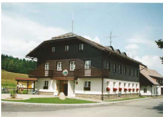
Informační středisko NPŠ na Kvildě, nedlouho po dokončení v roce 1996. Smlouvu s NPŠ na projekt jsme uzavřeli také koncem roku 1995. Dnes už bylo logo NPŠ nad vstupem odstraněno, škoda?