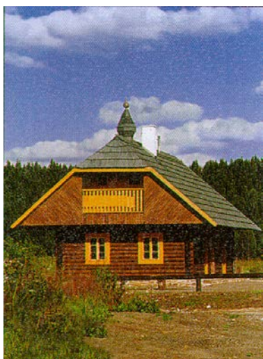
Strážní srub typu B pro 2. a 3. zónu NPŠ byl realizován na návrší Slunečné nad Prášilami koncem 90-tých let.

původní opravenou stavbu. Zajímavou byla naše účast architektů, také v r. 1995-6, na návrhu a realizaci Strážních srubů v nejtřeženějších zónách NP, tedy Strážní srub pro I. zónu NPŠ a pro zónu II. a III. Značili jsme je typ A a B . Pro 1. zónu bylo vybráno staveniště na břehu Plešného jezera, ale tam se Strážní srub nakonec nerealizoval. Realizoval se ale Strážní srub větší, určený pro 2. a 3. zónu NPŠ na návrší Slunečná nad Prášilami při silnici ze Srní. Myšlenka Strážních srubů, která vznikla na tehdejší Správě NPŠ, počítala se strážní službou po celém území parku, ale tak aby se omezil provoz automobilů a na strážních srubech bylo možno i přespát a několik dní i pobýt. Protože jsme všechny šumavské stavby pro park stavěli s místní stavební firmou „Lesostavby Třeboň“ pobočka Vimperk (ředitel ing. Meloun, hl. stavbyvedoucí ing. Ptáček), vytvořili jsme s touto firmou i nabídkový katalog pro strážní sruby a postoupili ho tenkrát i Lesům ČR.