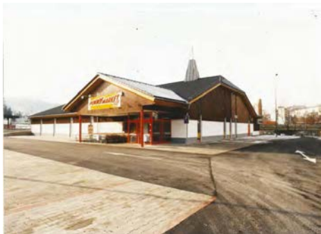
Prodejna Penny Market na autobusovém nádraží ve Vimperku, projekt 1999.