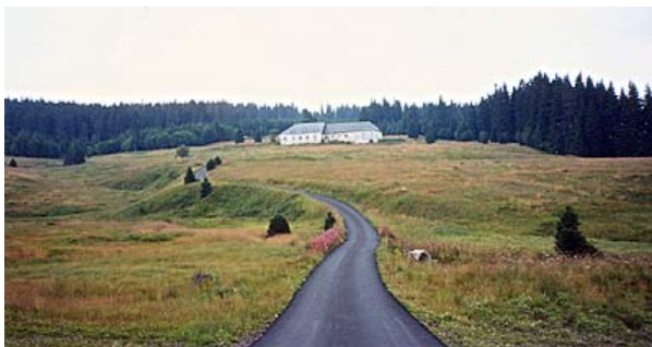
Kultovní hájovna – původní švarcenberská fořtovna Březník, dějiště známého románu Karla Klostermana „Ze světa lesních samot“. Smlouva na projekt s NPŠ byla uzavřena jen jeden měsíc po smlouvě na hrad Vimperk.