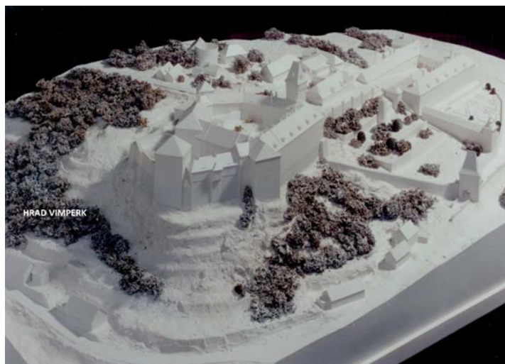
Hrad Vimperk v našem modelu v rámci našeho projektu pro program EU-PHARE. Smlouva na projekt s NPŠ uzavřena v říjnu 1995.