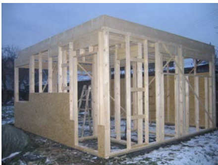
Vlevo hrubá stavba/krabice fošnové „two by four“. Listopad 2005.