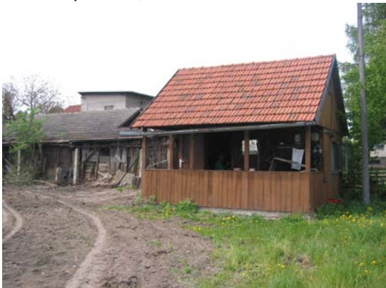
Stará chatička po tátovi. Nikdo z rodiny jsme neměli čas. 2004

Počátkem roku 2004 jsem po rodičích zdědil ve vesnici mého dětství v Čachovicích u Nymburka, zahradu ve Višňové ulici s dřevěnou chatičkou č.p. 75, u které jsem byl, když ji táta stavěl. Rozhodl jsem se k chatičce přidat bazén s plovárnou a vše o weekendech užívat. Už 14. 9. 2004 jsem dostal stavební povolení na rekonstrukci chaty, nové ing. sítě a nový bazén 3x5 m s plovárnou. Vše, ing. sítě, bazén a pod. šlo, ale chatička rekonstruovat ne, protože jak se jí tesaři dotkli tak spadla. Brouk tesařík