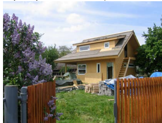
Jenomže chata rekonstruovat nešla, tak jsem začal stavět US systémem „TWO by FOUR“ chatu novou. Plot už je nový. 06/2006