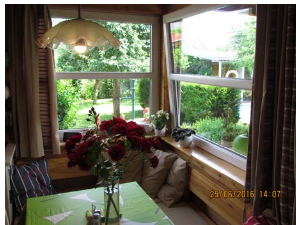
Vnitřní rohové posezení s rohovým oknem, které píše i z exteriéru.

Stavba byla v únoru 2008 přihlášena do celostátní soutěže „Energetická projekt 2007“. Soutěž jsme nevyhráli, ale získali jsme potvrzení o zachování standardu nízkoenergetické stavby. Aspoň myslím. Česká republika patří v EU k zemím s největším počtem domů 2. bydlení jako je tento. Máme jich asi 432 000. Tak jsme hned 2. Hned za Švédskem.