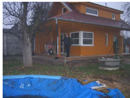
Vpravo téměř dokončený bungalow. Prosinec 2006.