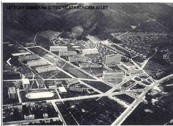
Realizový návrh architekta Gahury kolem r. 1930. Dnešní náměstí T. G. Masaryka, nebo také Gahurův prospekt, nebo urbanisticky „Zlínský diametr“. Měl by pokračovat doprava a dolů k řece Dřevnici, no a také o tom byla naše soutěž