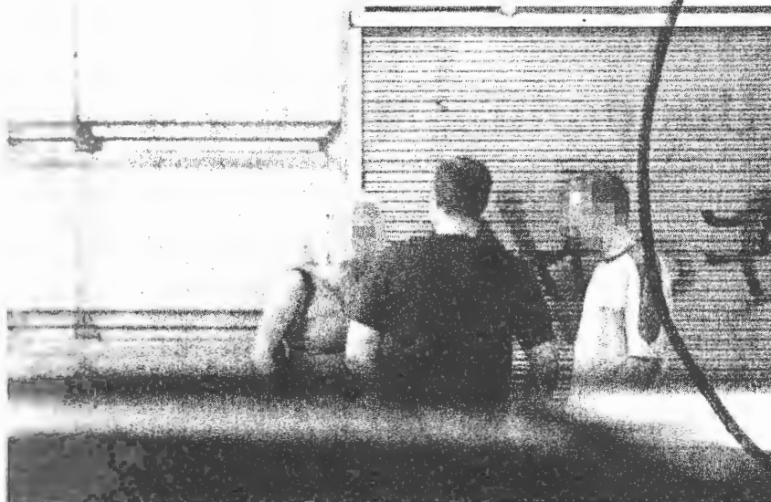
DOJ O CENĚ. Dívka, která ve středu v noci tvrdila, že šlape v Perlovce bez pasáka.

džinách. holky nevy- cy. napadlo mě, a kété obyčej- hou. a už vů- sem zvolila chy a lodič- ků to mělo a ijících se dí- ové. se výhrůžně