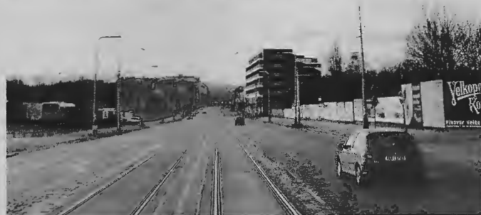
Jaroslav Trávníček, novostavba na Letné, zákresy do fotografie